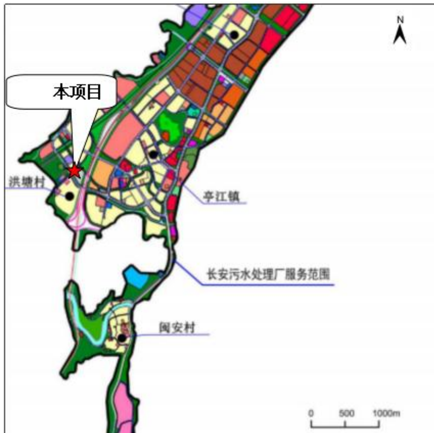
图 4.2-2 长安污水处理厂管线分布图

综上所述，本项目在长安污水处理厂服务范围内，所排放的水量、水质均符合长安污水处理厂进水水质接纳的要求。因此，项目建设后的污水接入长安污水处理厂是可行的。