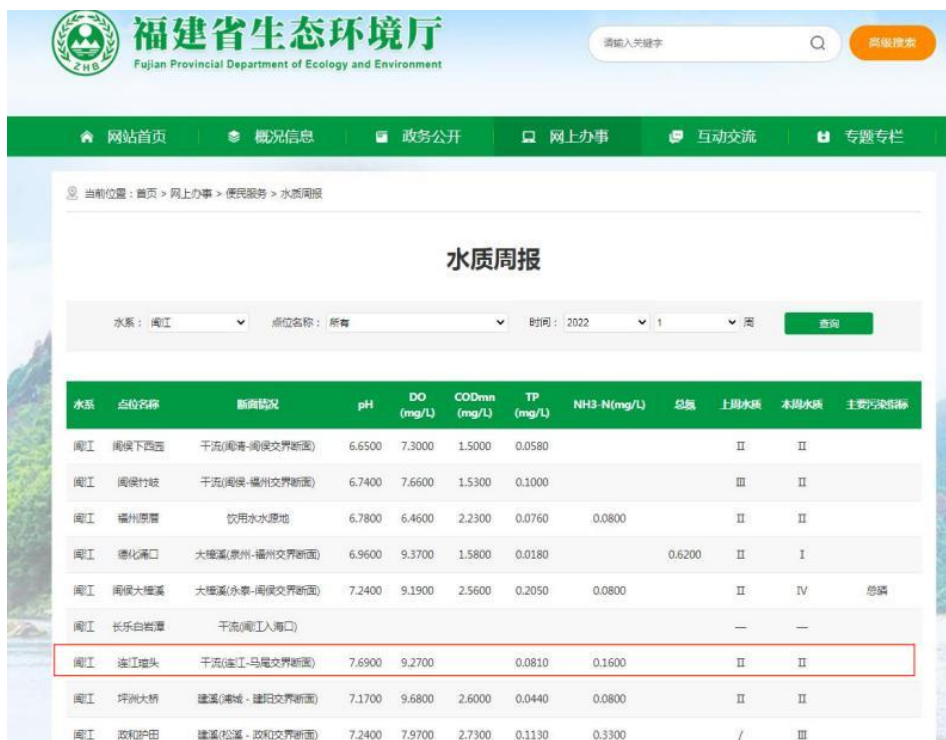
图 3.1-2 福建省重点河流断面水质状况（截图）

由此可知，闽江连江琯头断面水质能达到《地表水环境质量标准（GB3838-2002）》中III类水质标准。